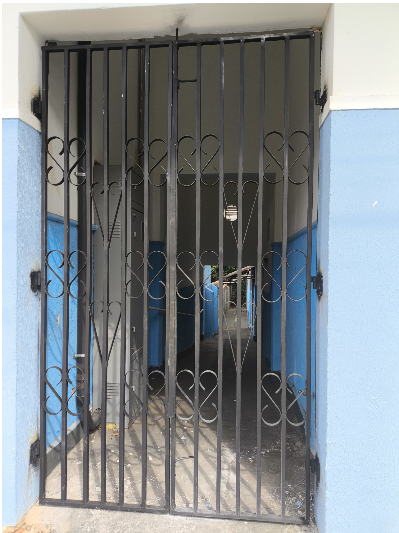
Portão lateral do cinema Municipal “Cine Jequitibá”, para dar acesso a rampa de cadeirantes.