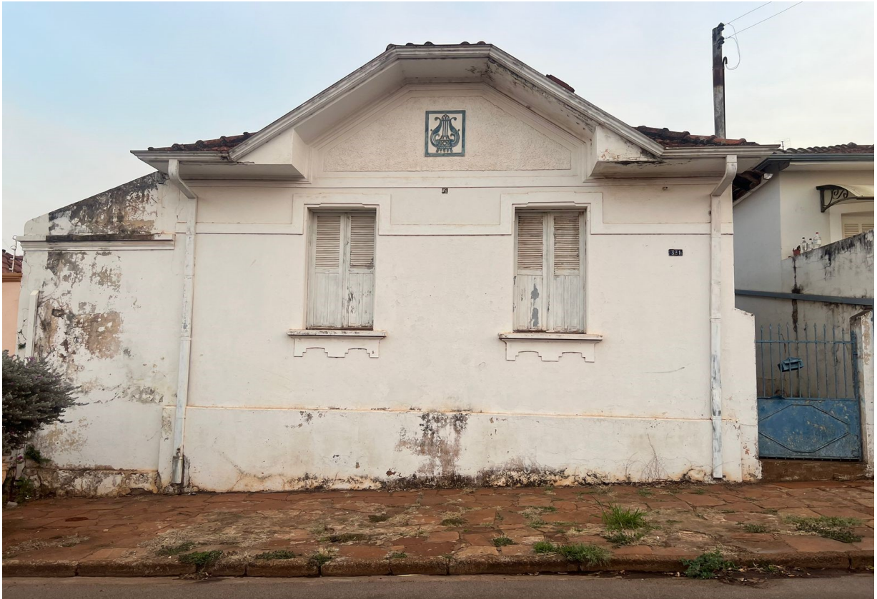
Antes e depois da reforma do Prédio da Corporação Banda Carlos Gomes de Bocaina. PROPONENTE: CORPORACÃO BANDA CARLOS GOMES DE BOCAINA.